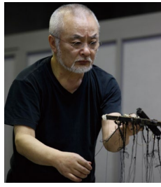
十二代目 結城孫三郎