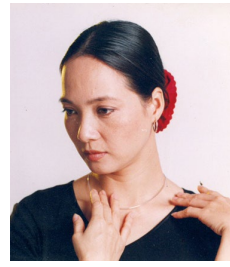
レ・カイン Le Khanh

原作 脚本・演出 人形美術・衣装 音楽・生演奏 ヘンリック・イプセン 坂手洋二 寺門孝之 太田恵資